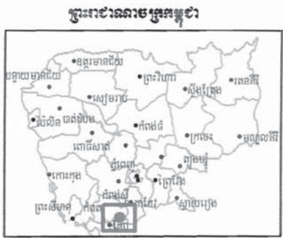
និយាមកាតោល