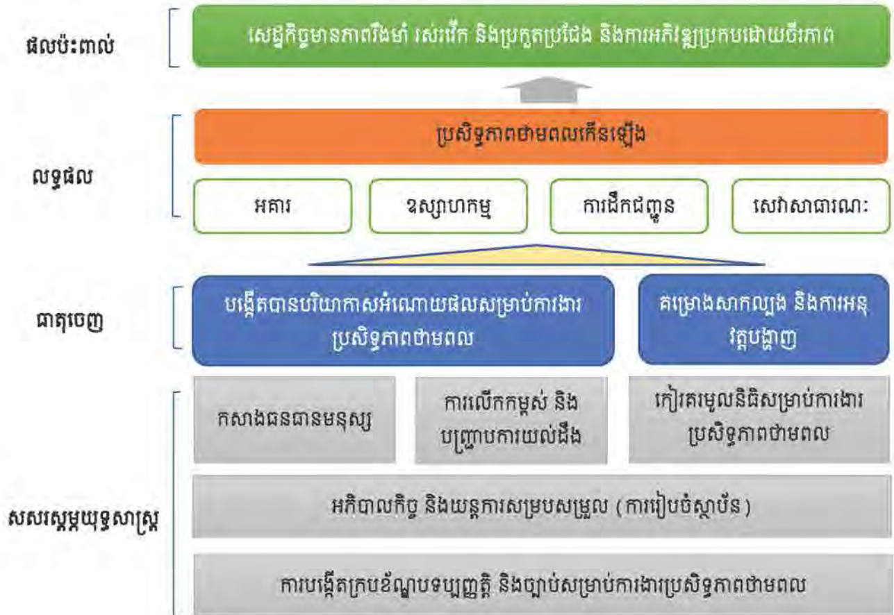
រូបភាពទី១៖ ក្របខណ្ឌយុទ្ធសាស្ត្រគោលនយោបាយជាតិស្តីពីប្រសិទ្ធភាពថាមពល

ទី១) ការបង្កើតក្របខណ្ឌច្បាប់និងបទប្បញ្ញត្តិសម្រាប់ប្រសិទ្ធភាពថាមពល ទី២) អភិបាលកិច្ចនិងយន្តការសម្របសម្រួល ទី៣) ការកសាងធនធានមនុស្ស ទី៤) ការលើកកម្ពស់ការយល់ដឹង និងការបញ្ជ្រាបព័ត៌មាន និង ទី៥) ការប្រមូលមូលនិធិសម្រាប់ការងារប្រសិទ្ធភាពថាមពល។