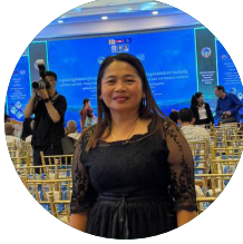
លោកស្រី អ៊ិច សុម៉ាលី

លោកស្រី នូវ ស្រីលាប គឺជាសិល្បៈការិនីល្ខោន និងជាអ្នកដឹកនាំរឿងនៅកម្ពុជា ហើយក៏ជាស្ថាបនិកនៃក្រុមសិល្បៈល្ខោនឆ្មុះផងដែរ។ ជាមួយនឹងបទពិសោធន៍ជាង ១០ ឆ្នាំ លោកស្រីធ្វើការលើទម្រង់ល្ខោនសហគមន៍ និងចូលរួមក្នុងសកម្មភាពសង្គម ដែលផ្តោតលើសមភាពយេនឌ័រ ការផ្តល់អំណាចដល់ស្ត្រី និងសិទ្ធិមនុស្ស។ លោកស្រីធ្លាប់បានសហការជាមួយសមាគមហ្វារេនីស៊ីល្យៈ Theatre du Soleil និង Global Art Corp ដោយចូលរួមសម្តែងទាំងក្នុងប្រទេស និងលើឆាកអន្តរជាតិ។ ក្នុងនាមជាអ្នកប្រឹក្សាឯករាជ្យ លោកស្រីបានអភិវឌ្ឍគម្រោងល្ខោនរឿង សម្របសម្រួលសិក្ខាសាលា និងធ្វើជាអ្នកណែនាំសម្រាប់សហគមន៍ងាយរងគ្រោះ។ ការងាររបស់លោកស្រីផ្តោតលើវិធីសាស្ត្របែបចូលរួម និងប្រកបដោយបរិយាបន្ន ដែលប្រើប្រាស់ល្ខោនជាឧបករណ៍សម្រាប់ការពិភាក្សា និងការផ្លាស់ប្តូរសង្គម។